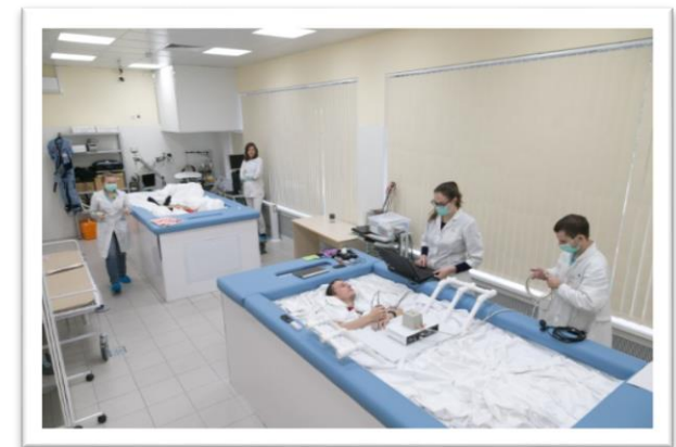
Стендовая база «Сухая иммерсия»

В его состав входят: помещение под ЦКР; система медицинского обеспечения, включая пост врача и средства управления медицинским оборудованием; система управления ЦКР; включая пульт инженера; система питания и автоматики, специально оборудованного помещения (само устройство ЦКР, система питания и автоматики, пульта врача и инженера, система управления, соединительные кабели и коммутационные устройства); эксплуатационная документация.