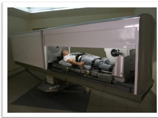
Стенд «Центрифуга короткого радиуса»

В его состав входят: экспериментальные установки (ЭУ) (модули) – ЭУ-50, ЭУ-100, ЭУ-150 и ЭУ-250; имитатор инопланетной поверхности (ИИП); рабочие места персонала при подготовке и проведении эксперимента; места приема пищи, отдыха и проведения личной гигиены персонала обслуживающего эксперимент; системы обеспечения жизнедеятельности (СОЖ) экспериментальных модулей; система видеонаблюдения и контроля (СВН) корпуса, в котором расположен НЭК; инженерные системы корпуса, в котором расположен НЭК (кондиционирование, энергоснабжение, холодоснабжение, пожаротушение, пожарная сигнализация и т.д.).